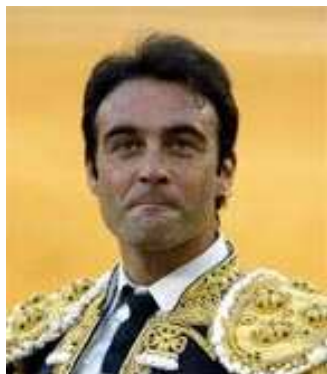
Marfil y oro