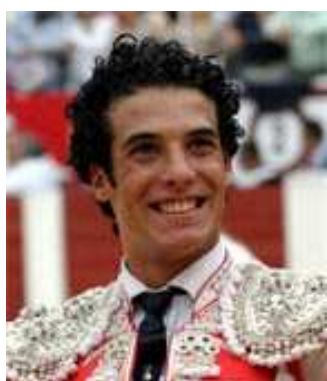
Azul marino y oro