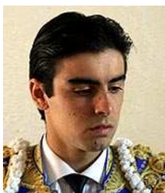
Carmesí y oro