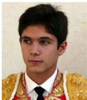
Azul rey y oro