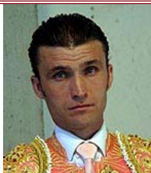
Rosa y oro