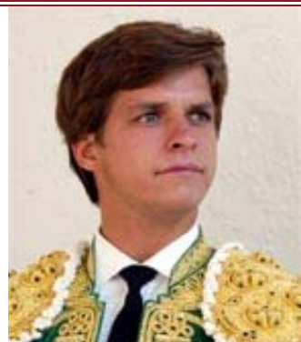
Sangre de toro o Nazareno y oro