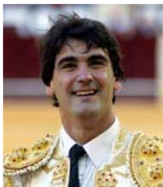
Gris o grana y oro