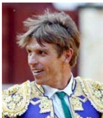
Rosa o blanco y oro