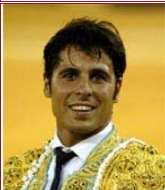
Azul marino o azul rey y oro